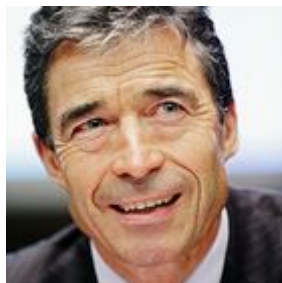
Андерс Фог Расмуссен

Андерс Фог Расмуссен (Anders Fogh Rasmussen) – генеральный секретарь НАТО в 2009-2014 годах, бывший премьер-министр Дании, основатель фонда «Альянс демократий».